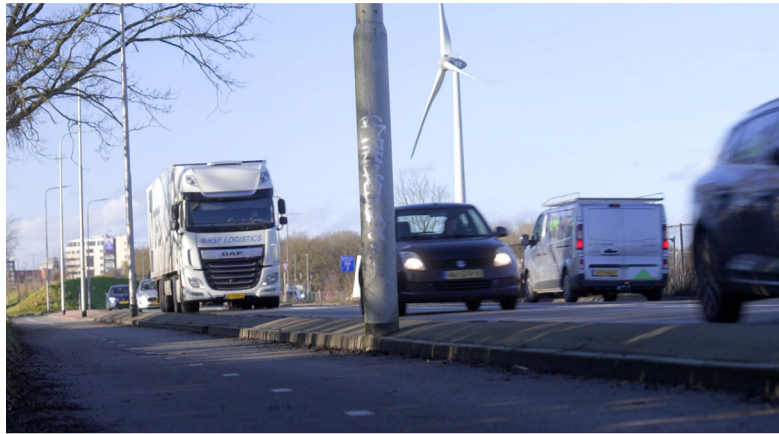
De provincie maakt er werk van om het verkeer op de N348, tussen Epse en de op- en afrit naar de A1 bij Deventer, veilig en vlot te laten doorstromen.

De stuurgroep van dit project, bestaande uit bestuurders van provincie Gelderland, gemeente Deventer en gemeente Lochem, heeft alle reacties en belangen zorgvuldig afgewogen. Op basis