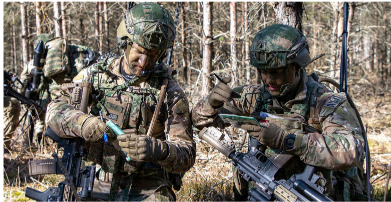
Militairen tijdens een oefening.

De oefening begint op 3 maart vanaf militair oefenterrein Scherpenberg bij Apeldoorn. Vandaar trekken de militairen in opleiding naar de omgeving van Zutphen en Goor. Zij voeren