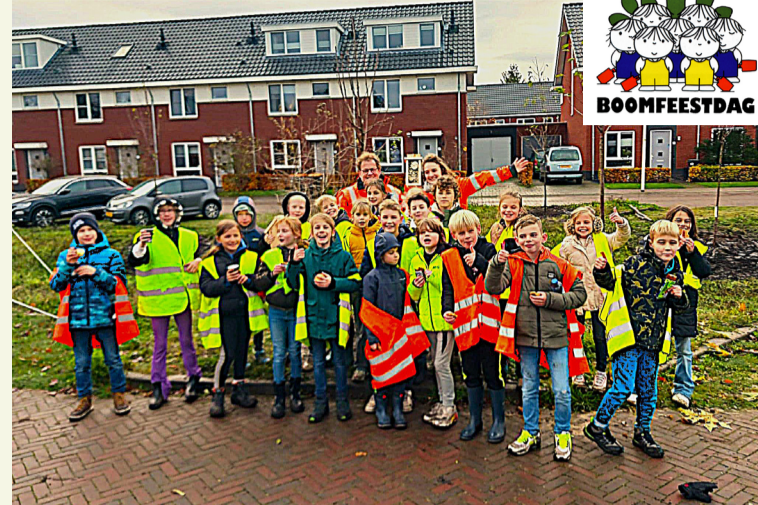
Leerlingen van openbare daltonbasischool De Branink in Laren vermaakten zich prima tijdens de Nationale Boomfeestdag.

Woensdag 20 november was het Nationale Boomfeestdag. Ook in de gemeente Lochem weer reden om samen met kinderen uit groep 6 en 7/8 groen aan te planten. Dit jaar in Epse en Laren. Circulus zorgde voor struiken, bomen en het gereedschap. Wethouder Lex de Goede (Openbare ruimte) moedigde de kinderen ook dit jaar aan tijdens hun werkzaamheden.