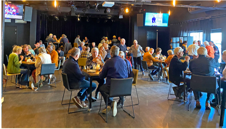
De nieuwe inwoners maakten op een mooie en gezellige manier kennis met de gemeente en vooral met Lochem.

Zaterdagochtend startten we met een kennismaking met burgemeester en wethouders, een ludieke kennisquiz en een video