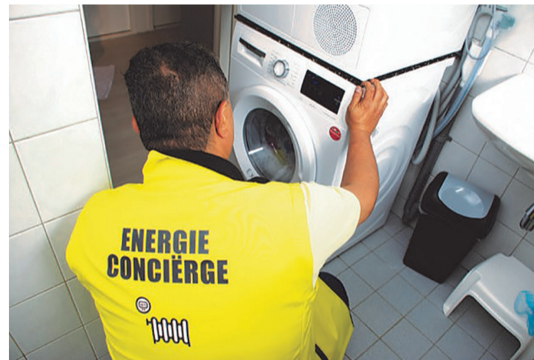
Een Energieconciërge van LochemEnergie tijdens een huisbezoek.

Gas en stroom blijven erg duur. En door de onrust in de wereld is het niet uitgesloten dat er weer een energiecrisis komt. Voorkomen is nog altijd beter dan genezen, dus alle redenen om te kijken waarmee u energie kunt besparen. Dat ziet u direct terug op uw energierekening. De gemeente Lochem blijft daarvoor geld beschikbaar stellen tot in ieder geval eind 2025.