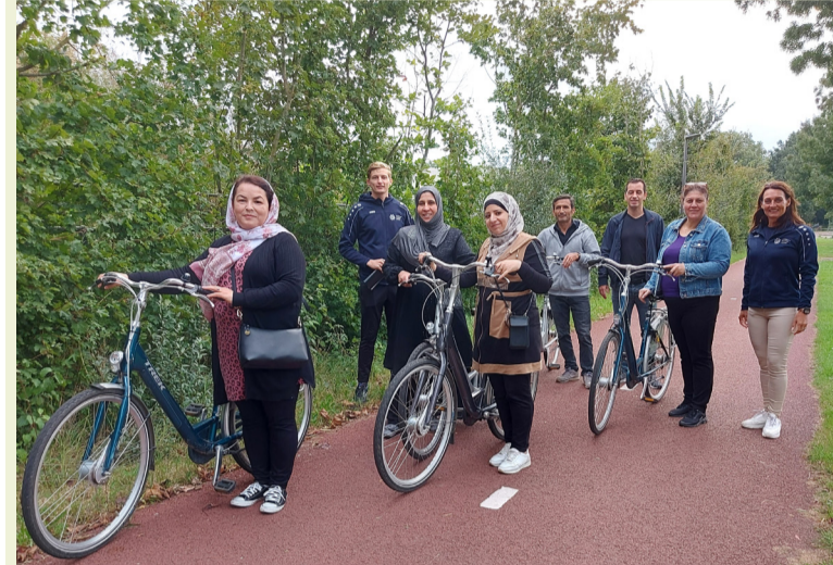
De visie 'Een thuis in de gemeente Lochem voor nieuwkomers' is aangescherpt. De visie betreft niet alleen huisvesting, maar bijvoorbeeld ook dat we willen dat iedereen kan meedoen in het dagelijkse leven. De visie is te lezen op www.lochem.nl .

en locatiekeuze asielopvang. De visie staat ook op de raadsagenda. De tafels zijn live vanuit huis te volgen. Zie de raadsagenda in dit gemeentenieuws. Of kijk op lochem.nl/politiekeavond