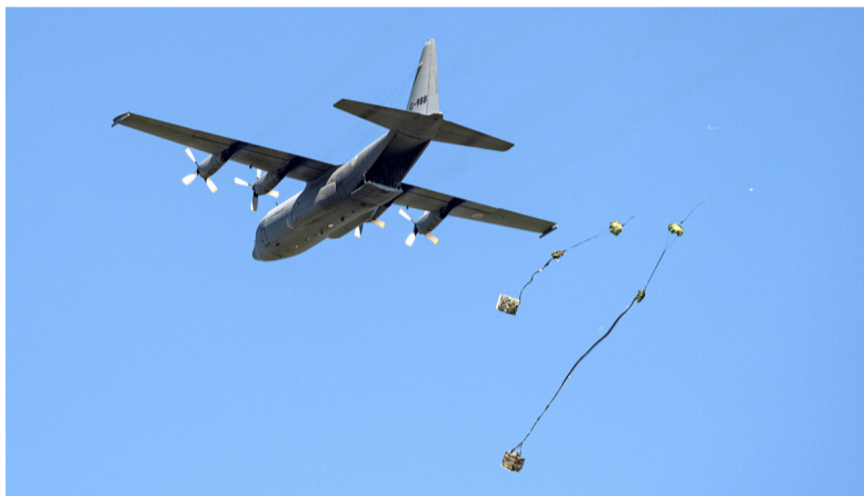
Een vliegtuig dropt zijn lading tijdens een eerdere editie van oefening Falcon Leap.

Droppingen Gedurende de eerste week van Falcon Leap wordt het droppen van vracht geoefend boven de Marnewaard (Groningen) en diverse locaties in Midden-Nederland en in België. De tweede week van de oefening staat in het teken van het droppen van parachutisten en vracht. De parachutisten landen op