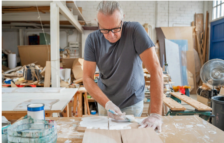
In onze gemeente doen zo'n 28 kunstenaars met een eigen atelier mee tijdens het Landelijk Atelierweekend.

Tijdens het Landelijk Atelierweekend krijgen kunstliefhebbers