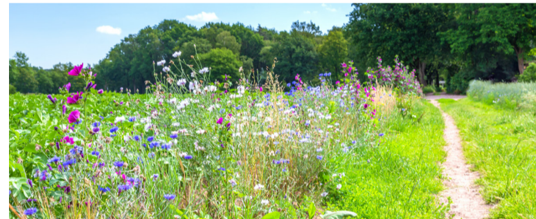
Vanuit ons biodiversiteitsplan ondersteunen wij graag initiatieven. Zoals het inrichten van een bloemrijke groenstrook.

Van het plaatsen van nestkasten samen met de buurt en het bloemrijk inrichten en onderhouden van een groenstrook tot het organiseren van een lezing over biodiversiteit. Heeft u een idee om met biodiversiteit in uw eigen leefomgeving aan de gang te gaan, vraag dan subsidie aan. Wij ondersteunen uw initiatief graag vanuit ons biodiversiteitsplan.