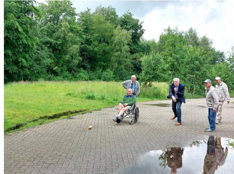
Wethouder Lex de Goede nam even deel aan het klootschieten.

Van 27 tot en met 31 mei nam 't Overschotje deel aan de Nationale Bewegeweek voor ouderen. Voor deze gelegenheid was ook klootschietvereniging Klein Dochteren van de partij. Wethouder sport Lex de Goede bezocht woensdag 29 mei De Derde Helft bij sportvereniging 't Overschotje in Lochem. Hij sprak met verschillende deelnemers en deed een rondje mee met klootschieten.