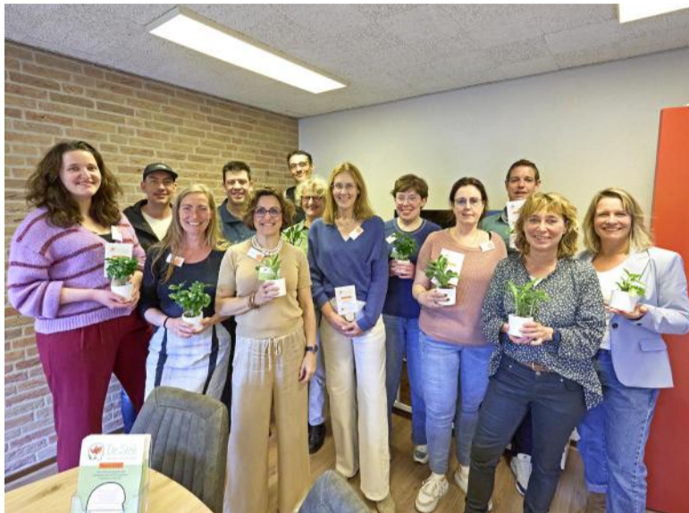
Inloophuis De Stek is een initiatief van de gemeente Lochem samen met GGNet, Tactus, 't Baken, IxtaNoa, Vriendendiensten Deventer en het BIC-Lochem.

De Stek is te vinden in het pand van het BIC: Bezielend Inspiratie Centrum, aan de Noorderwal 17 in Lochem. Daar is een eigen huiskamer en een gastvrije