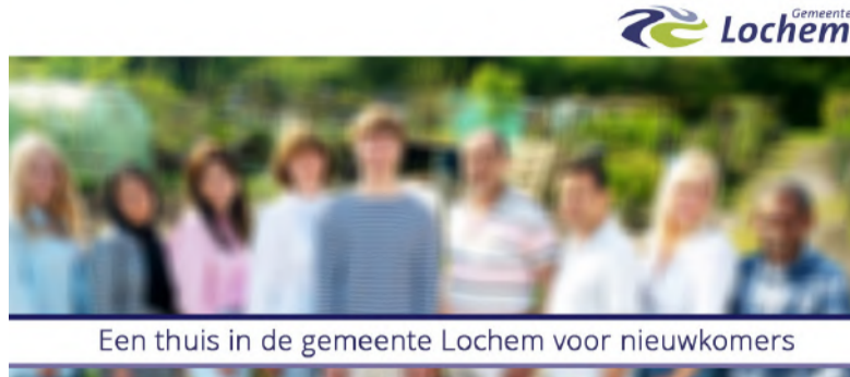
Een thuis in de gemeente Lochem voor nieuwkomers

Dat is de kern van de visie 'Een thuis in de gemeente Lochem voor nieuwkomers'. De visie is de basis voor